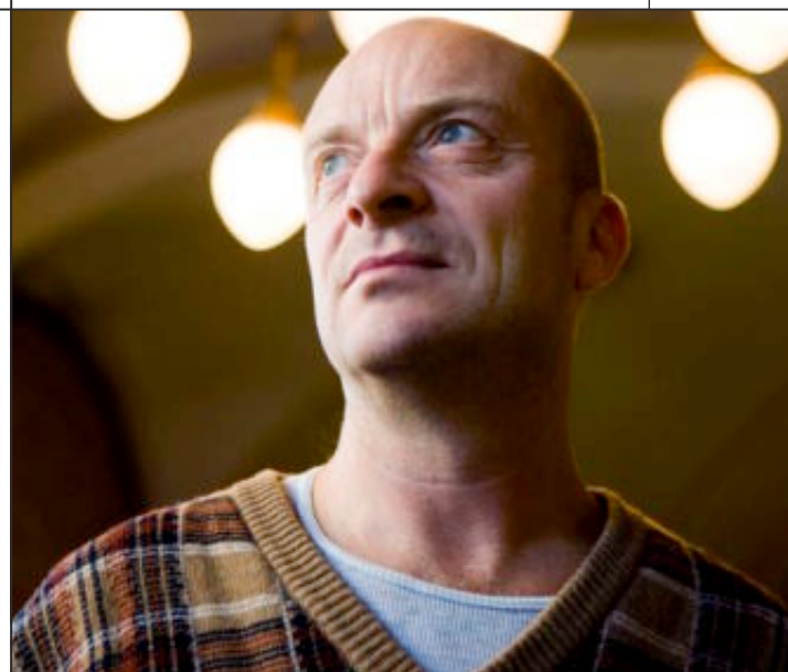
Jonas Gardell.

– Men det kjem kanskje for få verkeleg gode bøker? I så måte kan forfattarutdanningane vere med på å gjere forfattarene betre. Eg trur heller ikkje at det ville ha kome færre bøker om ikkje desse utdanningsmogleheitene fanst.