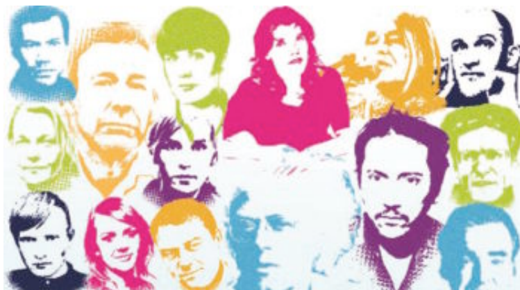
Slik ser dei ut, forfattarene som gjestar Moss i helga.