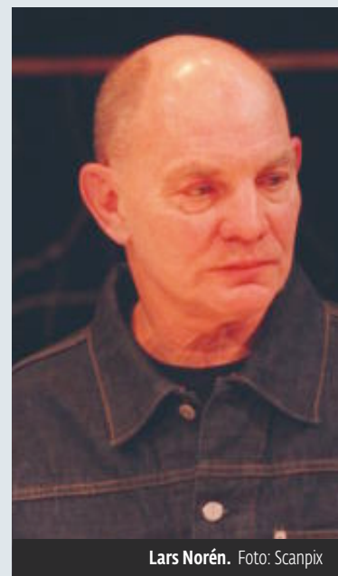
Lars Norén.

– Kanskje kjem det ut for få verkeleg gode bøker.